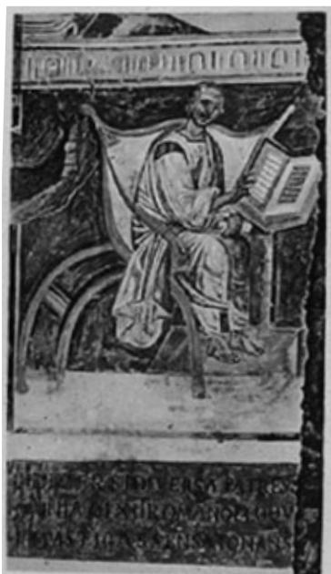
Het oudst bekende portret van Augustinus, bisschop van Hippo. Fresco Biblioteca del Laterano, eind 6de eeuw.

Het bovenstaande leidt eerder tot de veronderstelling dat God zijn heilsplan in allerlei fasen ontvouwt, waarbij materiële en geestelijke aspecten van belang zijn, evenals voorwaardelijke en onvoorwaardelijke kanten (God reageert op geloof en ongeloof, maar volvoert zijn plan). Daarbij is het van belang in te zien dat God nu reeds een deel van zijn beloften realiseert, terwijl die in de toekomst nog rijker verwerkelijkt zullen worden.