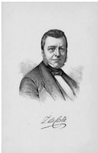
Isaac da Costa