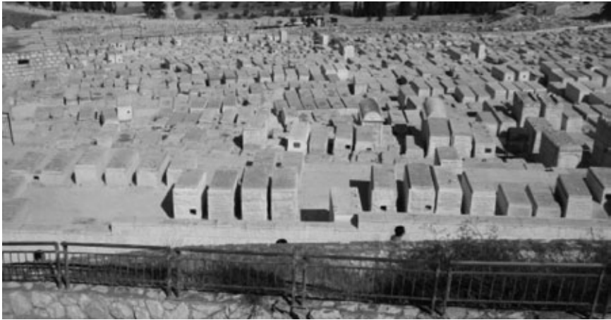
Joodse graven op de Olijfberg. Velen wilden hier begraven worden op grond van de toekomstverwachting in Zacharia 14:4.

Met deze stellingname neemt Brakel afstand van een belangrijk uitgangspunt van Calvijn en de kanttekenaren op Zacharia. Wanneer de beloften in Zacharia 12 en 14 betrekking hebben op het Joodse volk, moet dat nog vervuld worden. Brakel kiest voor de eschatologische uitleg. Daarmee gaat hij van het tweede hoofdstandpunt naar het derde.